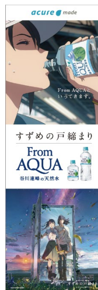
側面ステッカーイメージ