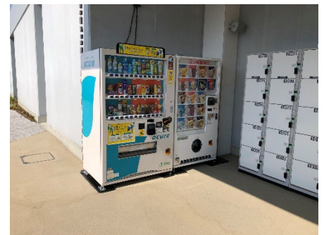
（画像左から）【改札内】①「ナチュラキュア」②「プラスアキュア」③「アキュアの自販機」【改札外】④アイス自販機⑤「アキュアの自販機」