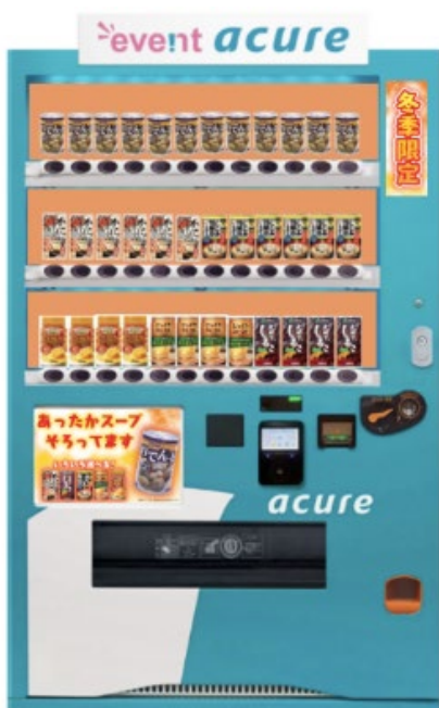
自販機画像はイメージです。