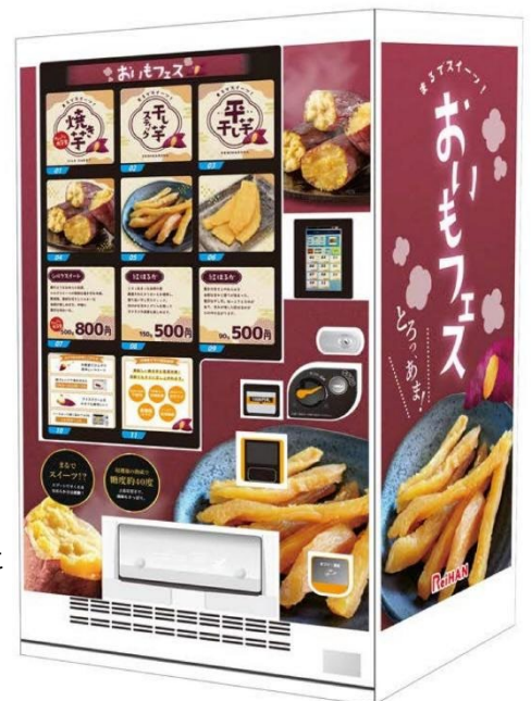
自販機画像はイメージです。