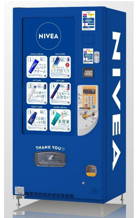
自販機画像はイメージです。